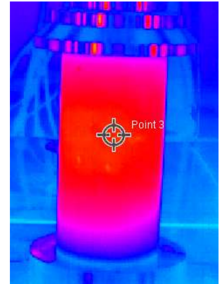
Pendant la sollicitation mécanique