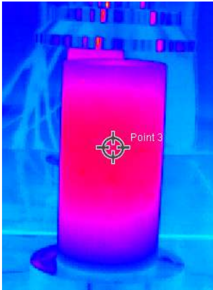
Avant la sollicitation mécanique