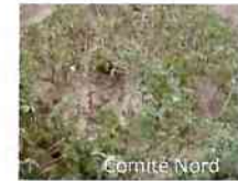
Rhizoctonia solani, Fusarium, Phytophthora infestans...